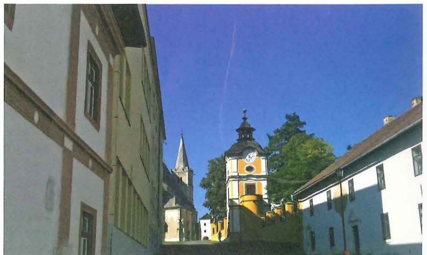
Kapitula Spišská in der Slowakei, das jüngste EBZ

Wir befinden uns im Zipser Kapitel, wie Spišská Kapitula auf Deutsch heißt; mit Blick auf die großartige Zipser Burg aus Travertin, dahinter das kleinste Hochgebirge Europas, die Hohe Tatra – nicht weit entfernt die Bezirkshauptstadt Košice – und alles eingebettet in eine noch wenig bekannte Kulturlandschaft mit einem ganzen Ring gotischer Kirchen. Die inhaltliche Europaarbeit